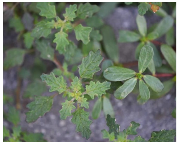
Dysphania pumila und Portulaca oleracea , Taborstraße (2. Bezirk).